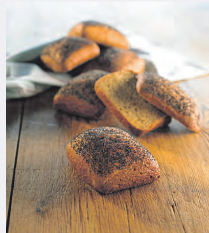
Lantmännen Reppe tillverkar bland annat gluten till bagerinäringen.