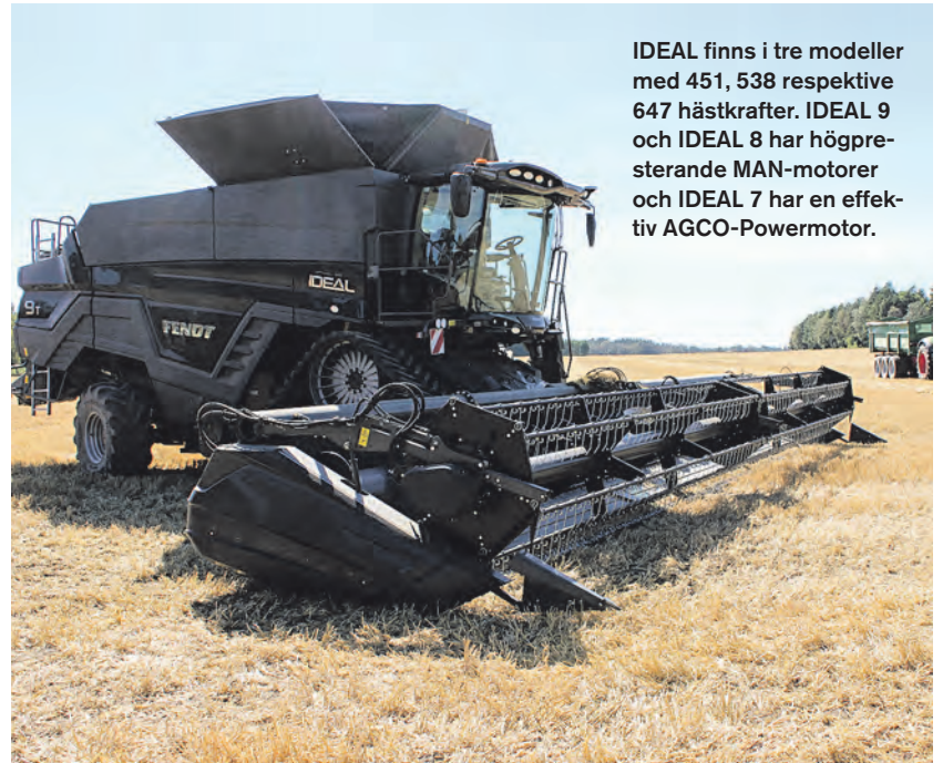
IDEAL finns i tre modeller med 451, 538 respektive 647 hästkrafter. IDEAL 9 och IDEAL 8 har högpresterande MAN-motorer och IDEAL 7 har en effektiv AGCO-Powermotor.